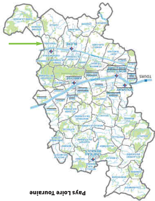
Pays Loire Touraine