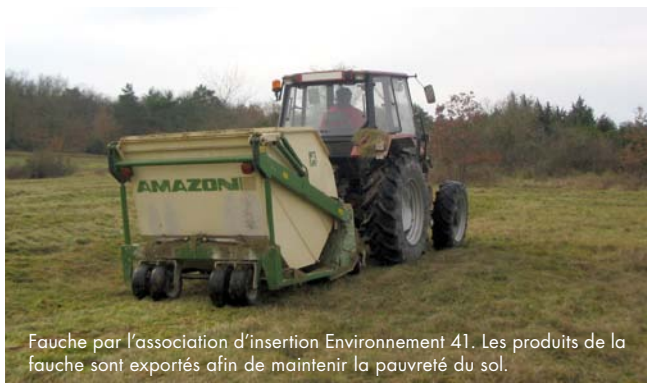
Fauche par l'association d'insertion Environnement 41. Les produits de la fauche sont exportés afin de maintenir la pauvreté du sol.

Cet entretien des milieux dits ouverts est réalisé chaque année grâce à la fauche ou grâce au pâturage.