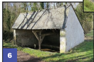
Lavoir St André