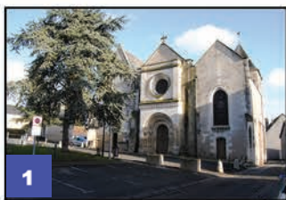
Église du XII e siècle